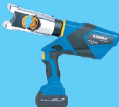
EK120UCFMSET20 2 978 €

120kN, Cu/Al até 400mm 2 Inclui matrizes de Cobre 70 a 240mm 2