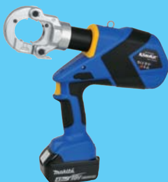
EK6022CFMSETL 2 989 €

120kN, Cu/Al até 400mm 2 Inclui matrizes de Cobre 70 a 240mm 2