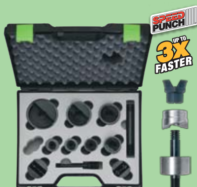
52055440SET 507 €

Hidráulico a bateria Li-ion 18V Cabeça roda 360° Leve mas potente