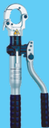
HK6022SETL 1 305 €

120kN, Cu/Al até 400mm 2 Inclui matrizes de Cobre 70 a 240mm 2