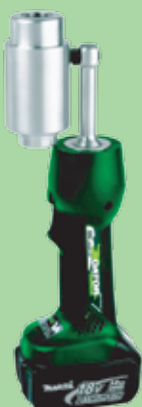
LS50FLEXCFM 1 567 €

Hidráulico a bateria Li-ion 18V Cabeça roda 360° Leve mas potente