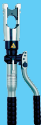
HK120USET20 1 599 €

35kN, Cu/Al Inclui matrizes de Cobre 6 a 150mm 2