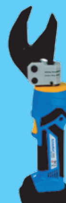
ES32ML 909 €

60kN, Cu/Al até 300mm 2 Inclui matrizes de Cobre 16 a 240mm 2