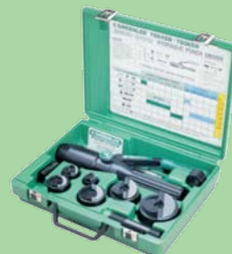
50356119SET 699 €

Estojo Speed Punch ISO 16-63 sem eixo roscado, até 3x mais rápido Inclui: Ø 16,2 / 20,4 / 25,4 / 32,5 / 40,5 / 50,8 / 64 mm