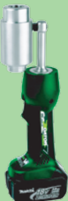
LS50FLEXCFM 1 499 €

Hidráulico a bateria Li-ion 18V Cabeça roda 360° Leve mas potente