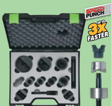
52055440SET 485 €

Hidráulico a bateria Li-ion 18V Cabeça roda 360° Leve mas potente